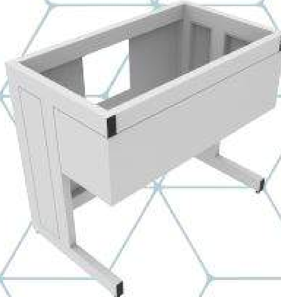
TAPAS PARA TARJA

Mesa estructural fabricado en perfil tubular rectangular de 3" x 1-1/2" con acabado con pintura híbrida epoxi-poliéster en polvo de aplicación electrostática.