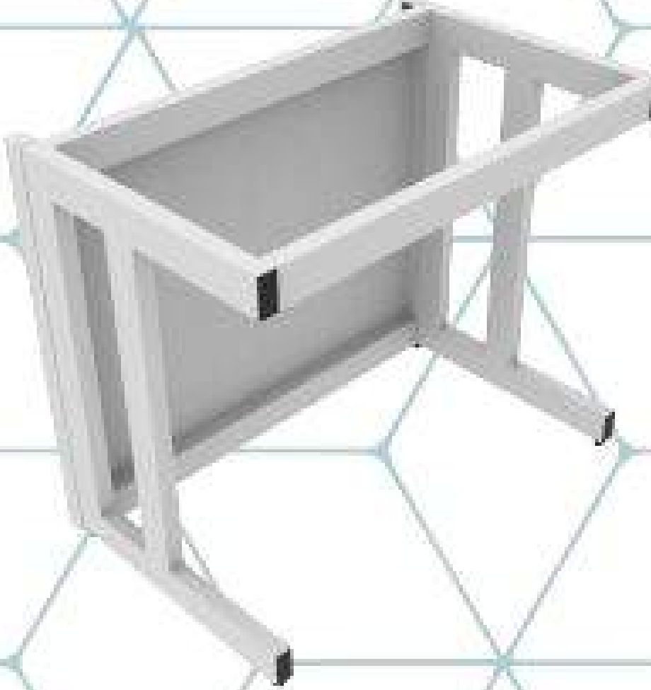
TAPAS PARA SERVICIOS