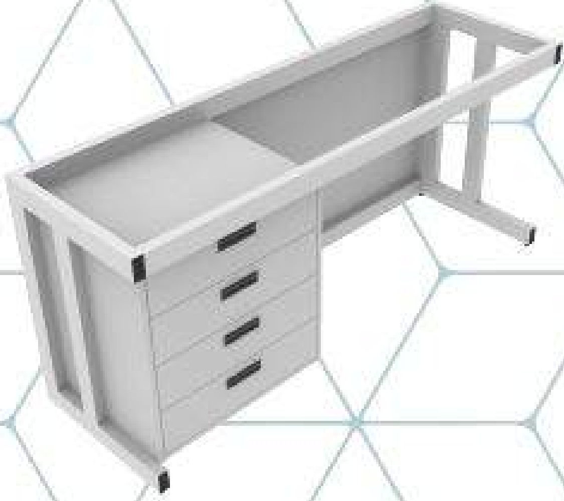
MESA CON GABINETE SUSPENDIDO