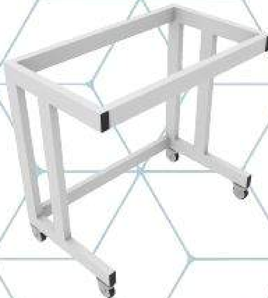
ESTRUCTURA CON RODAJAS